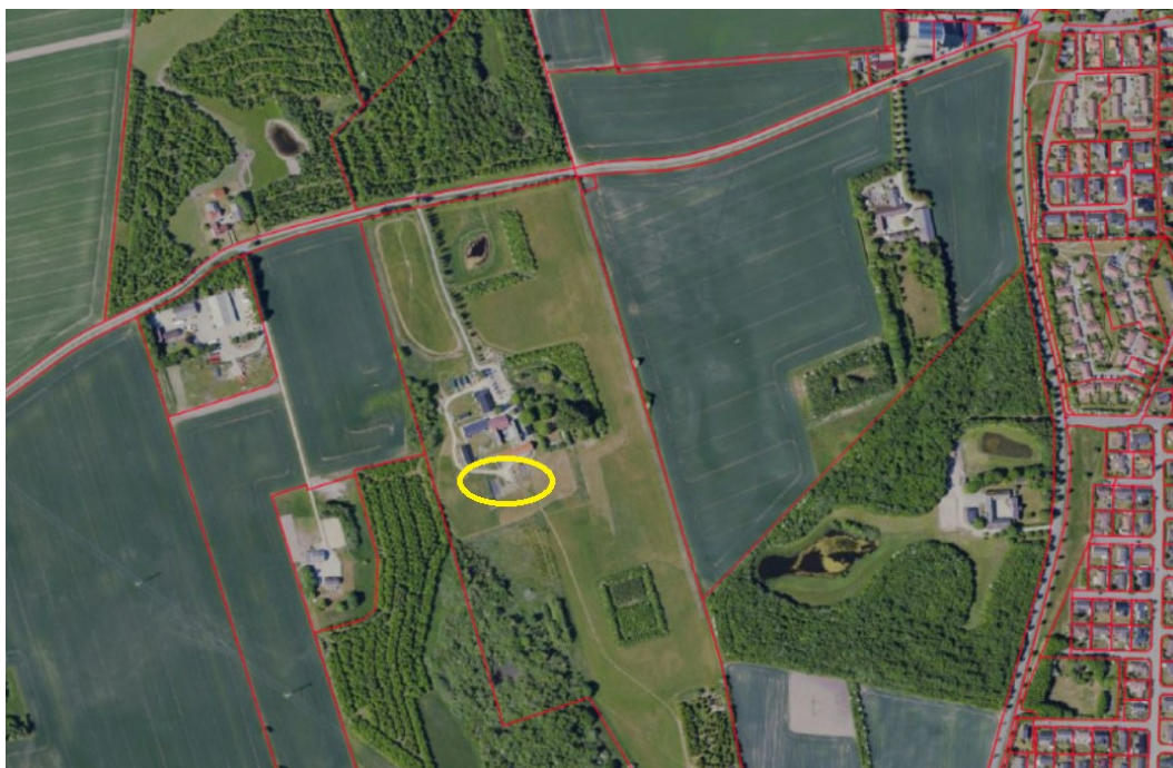
Figur 1. Oversigtskort over ejendommen og området. Den gule cirkel indikerer hvor festivalpladsen indrettes på ejendommen.

Vi har også lagt vægt på, at formålet med arrangementet er at understøtte bostedets arbejde med, at skabe et aktivt og socialt miljø, der udvikler selvværd, selvstændighed og kompetencer for en særlig gruppe af borgere, samt at arrangementet danner ramme for oplevelser, venskaber og nye relationer på tværs, til gavn for institutions beboere, brugere, deres familier og dem som deltager fra andre institutioner.